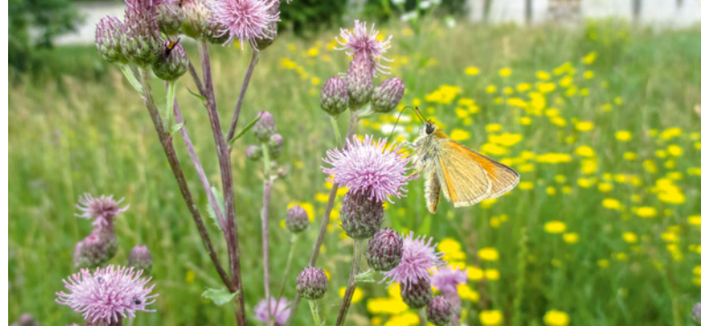
Wildwiese mit Dickkopffalter im Friedhof von Uehlfeld