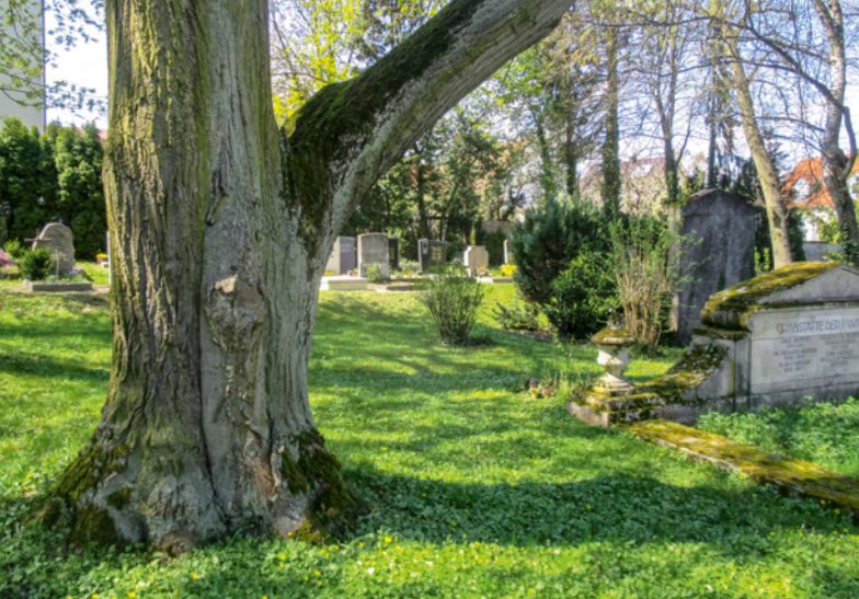
Evangelischer Zentralfriedhof Regensburg mit Strukturen: Alter Baum, Moose, Sträucher und Wiese