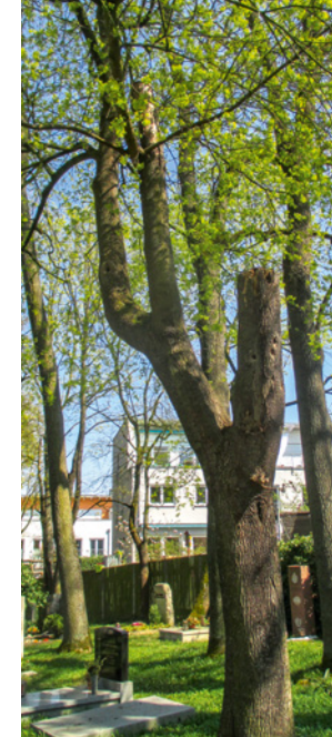
Höhlenbaum im Evangelischen Zentralfriedhof, Regensburg

Auch totes Holz birgt Leben: Hier finden sowohl Vögel wie auch etliche holzbewohnende Käferarten und Baumpilze einen Lebensraum. Unvermeidbare Verkehrsicherungsmaßnahmen sollten deshalb von einem qualifizierten, ökologisch orientierten Baumpfleger durchgeführt werden.